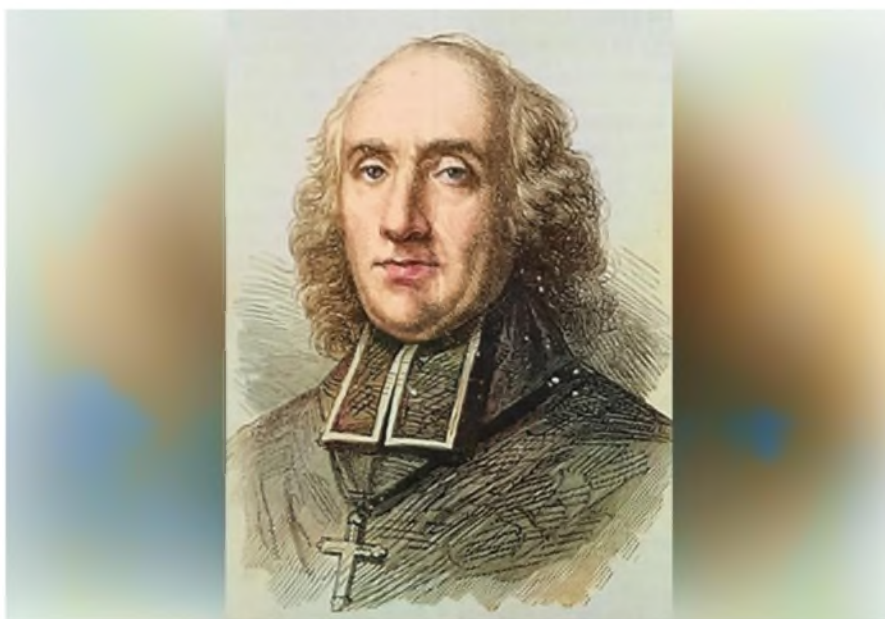
доктор Жан – Батист Дени

Впервые закон кровообращения был открыт в Англии Уильямом Гарвеем в 1628 году, что дало возможность формировать новое медицинское направление – трансфузиология. Первые удачные переливания крови начали проводить на собаках в 1666 году. В июне 1667 года при Французском дворе придворный доктор Жан – Батист Дени провел первое переливание крови человеку от животного. Больной пошел на поправку, но желающих экспериментировать на себе не прибавилось.